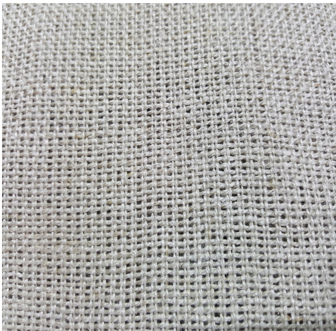
Flachsgewebe in Leinwand- bindung © Jana Winkelmann | Bild in Farbe und Druckqua- lität: www.fraunhofer.de/ presse .